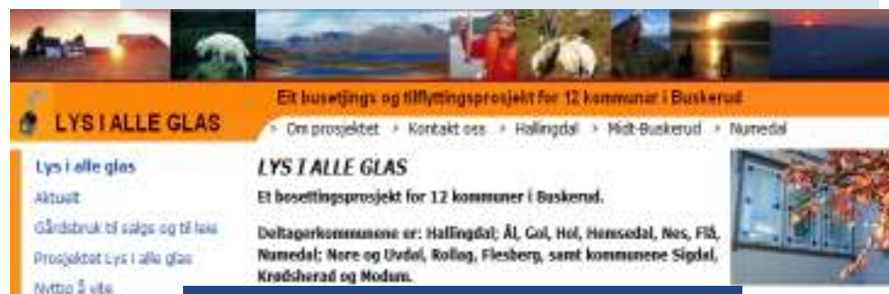
Light in Windows (Buskerud, Norway)