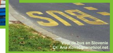
Voie de bus en Sloveenie