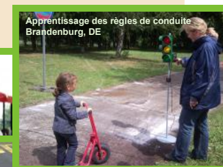
Apprentissage des règles de conduite Brandenburg, DE