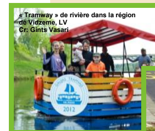
« Tramway » de rivière dans la région de Vidzeme, LV

Améliorer le transport durable en zones rurales et de montagne