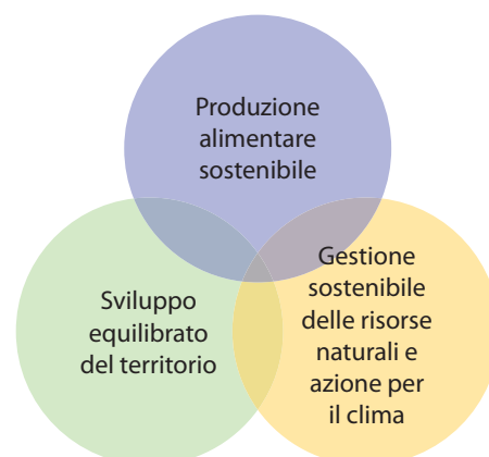
Obiettivi della nuova PAC