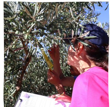
  MORE CoLab Diana S 

Hasta el momento, el grupo ha puesto en marcha 17 proyectos que abarcan temas como la valorizaci n de los subproductos del aceite de oliva, la reducci n del desperdicio de alimentos y la conservaci n y valorizaci n del patrimonio cultural.