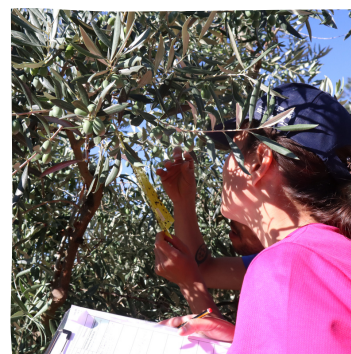
  MORE CoLab Diana S 

V skupini so doslej izvedli 17 projektov, ki pokrivajo vpra anja, kot so valorizacija podproizvodov iz olj nega olja, zmanj evanje koli in zavr ene hrane ter ohranjanje in valorizacija kulturne dediš ine.