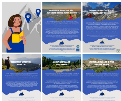
Petnajst zgodb državljanov o tem, kako kohezijska politika spreminja gorska območja