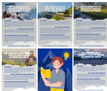
25 načinov za izboljšanje življenjskih razmer prebivalcev gora po poti kohezijske politike

Ne glede na to, ali ste podjetnik, gorski vodič, upokojenec, študent ali zaposleni, se lahko v vsakdanjem življenju srečate s kohezijsko politiko, ne da bi to vedeli. V okviru Montane174 skozi zgodbe petnajstih prebivalcev gorskih območij predstavljamo, kako kohezijska politika izboljšuje življenja ljudi.