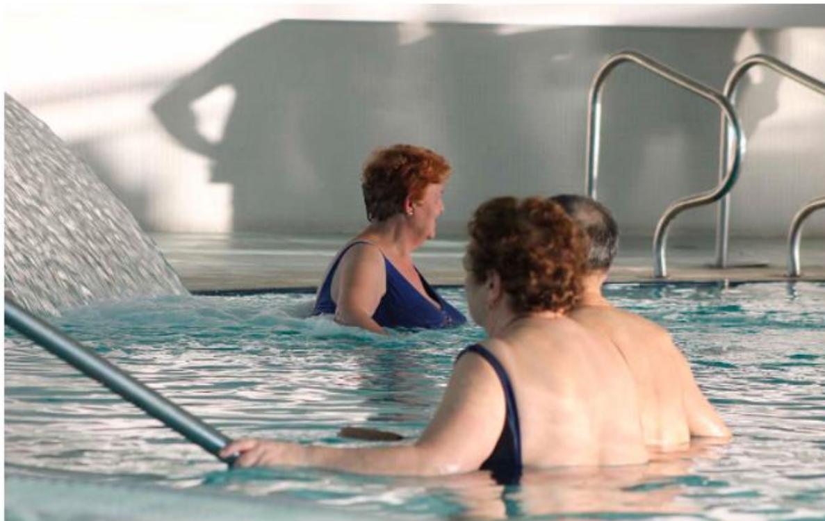
Un grupo de termalistas disfrutando en el Balneario de Ariño

La primera se celebrará el 19 de noviembre en la Cámara de Comercio en Alcañiz. El impacto de la 'Silver Economy' se tratará el día 29 en Ariño, mostrando el ejemplo del Balneario